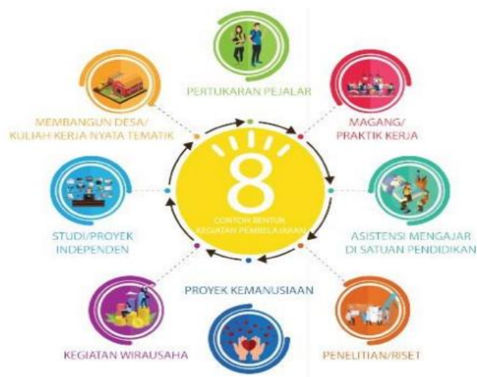
Gambar 3 Bentuk Kegiatan Pembelajaran (BKP) MBKM

Secara umum, kegiatan yang bisa dilakukan di luar prodi/MBKM adalah sebagaimana terlihat dalam Gambar 3.